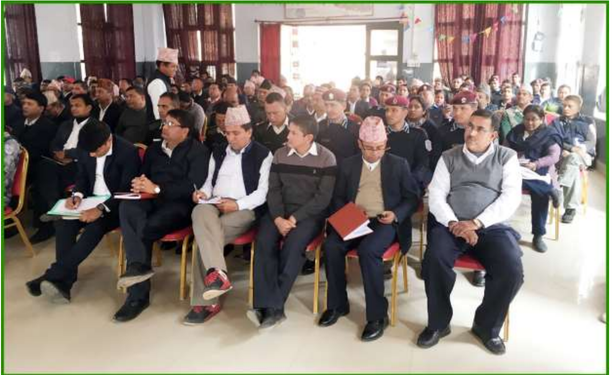
कर्णाली प्रदेश विरेन्द्रनगर, सुर्खेतमा आयोजित लेखापरीक्षण अन्तरक्रिया कार्यक्रममा सहभागी पदाधिकारीहरु