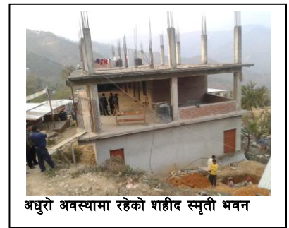
अधुरो अवस्थामा रहेको शहीद स्मृती भवन