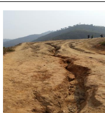
विच भागमा चिरा परेको सडक

१९.३. सिन्धुली निर्वाचन क्षेत्र नम्बर - ३ अर्न्तगत किरायाखोर भञ्ज्याङ्ग-रानीछाँगा-सिरुवारी सडकको लागि आर्थिक वर्ष २०७१।७२ मा रु. २ लाख ५० हजारको लागत अनुमान तयार गरी रु. २ लाख १९ हजारको कार्य सम्पन्न गरेकोमा आर्थिक वर्ष २०७२।७३ मा रु. १२ लाख ३७ हजारको लागत अनुमान तयार गरी सोही रकमको कार्य सम्पन्न गरेको छ । आयोजनामा माटो काट्ने कार्य मात्र भएको र आयोजनाको अन्तिम स्थान सम्म माटो काट्ने कार्य समेत सम्पन्न नभएकोले यातायात सञ्चालन हुने गरी कार्य सम्पन्न भएको छैन ।