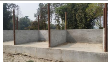
अधुरो अवस्थामा रहेको व्क

१९.५. सिन्धुली क्षेत्र नम्बर - २ अर्न्तगत हैवार गाउँ -कालढुङ्गा-देउराली सडकको लागि रु. १२ लाख ३६ हजारको लागत अनुमान बमोजिमको कार्य रु. १२ लाख १७ हजारमा सम्पन्न भएकोमा गत विगत वर्ष देखि निर्माण भईरहेको सडकको केही स्थानमा कार्य भएकोमा यातायात सहज रुपमा सञ्चालन हुने गरी सडकको कार्य भएको देखिँदैन ।