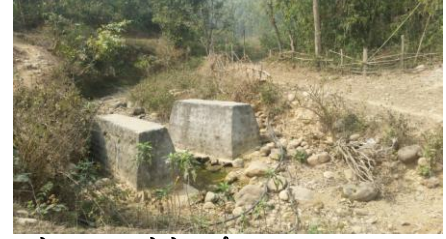
अधुरो अवस्थामा रहेको कल्भर्ट