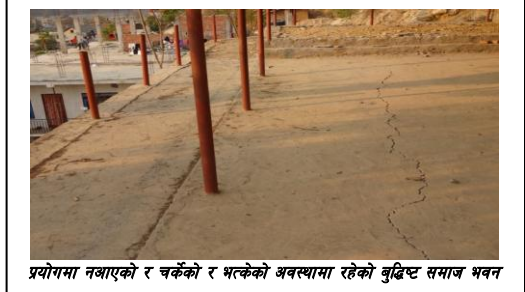
प्रयोगमा नआएको र चर्केको र भत्केको अवस्थामा रहेको बुद्धिष्ट समाज भवन