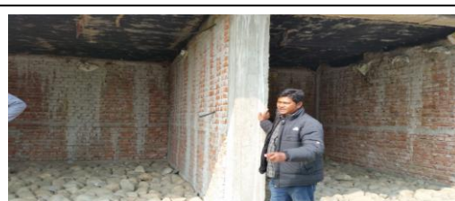
बजेट अभावको कारण अधुरो रहेको भवन

१९.२. सिन्धुली निर्वाचन क्षेत्र नम्बर - ३ अर्न्तगत कपिलाकोट गा.वि.स. (सिन्धुली) मा २ कोठे महिला सञ्जाल भवन निर्माणको लागि आर्थिक वर्ष २०७२।७३ मा रु. ३ लाख ८७ हजारको लागत अनुमान तयार गरी रु. ३ लाख ५१ हजारको कार्यसम्पन्न गरेको छ । पूर्ण रुपमा भवन निर्माण कार्य सम्पन्न नभई पिलर उठाउने, वाल लगाउने र ढलान गर्ने कार्य मात्र भई अन्य कार्य बाँकी रहेकोले भवन उपयोगमा आउन सकेको छैन ।